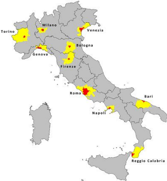
Figura 1 Le 10 città metropolitane nelle regioni a statuto ordinario, 2014